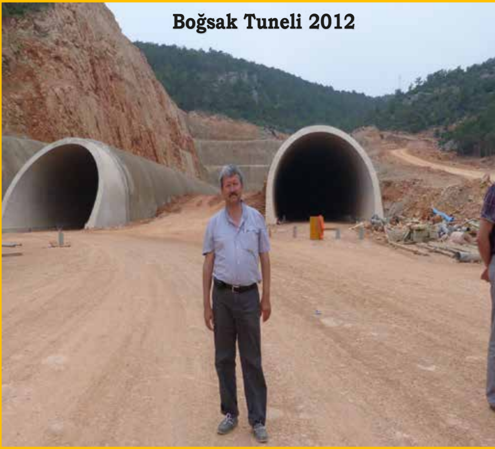
Boğsak Tuneli 2012