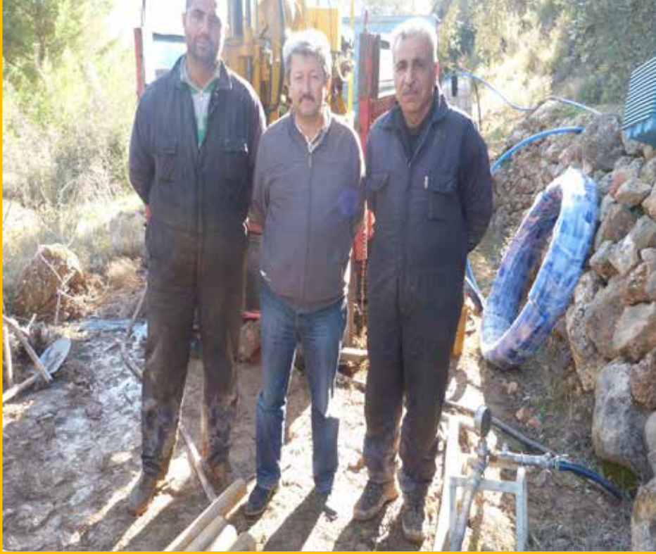
Silifke -Mut Yolu Viyadük Temel Sondajı 2008