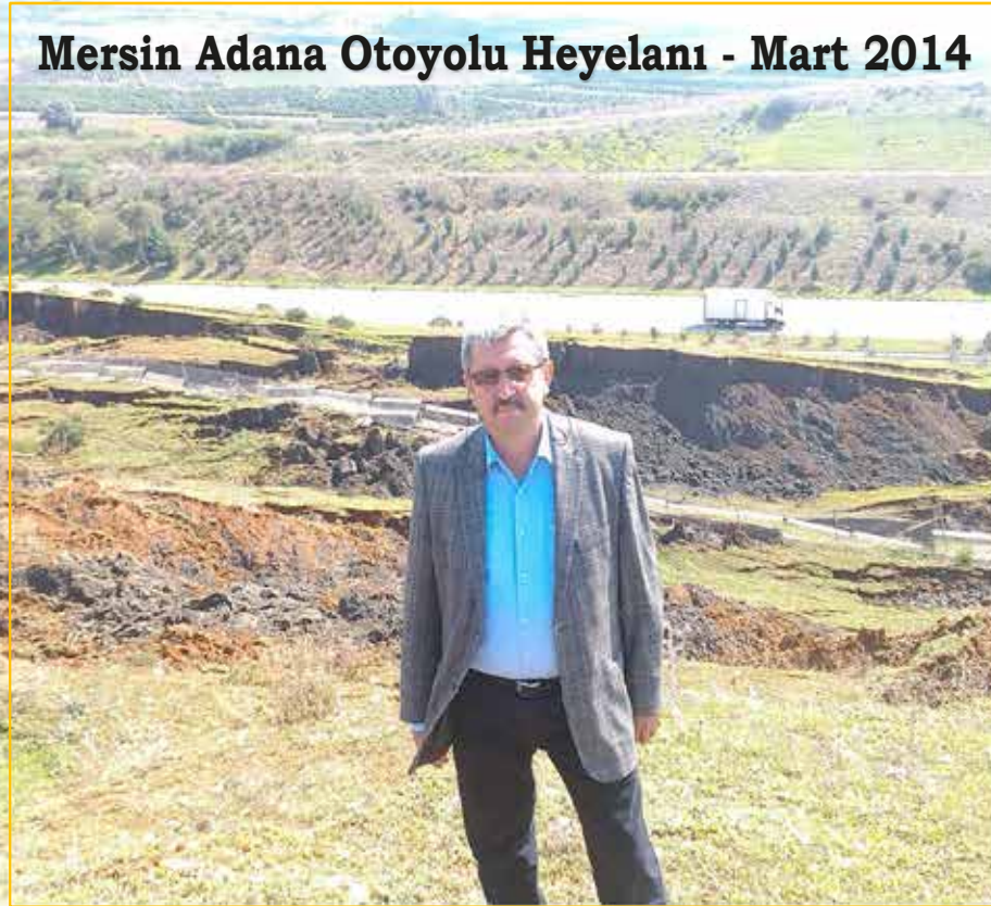
Mersin Adana Otoyolu Heyelanı - Mart 2014