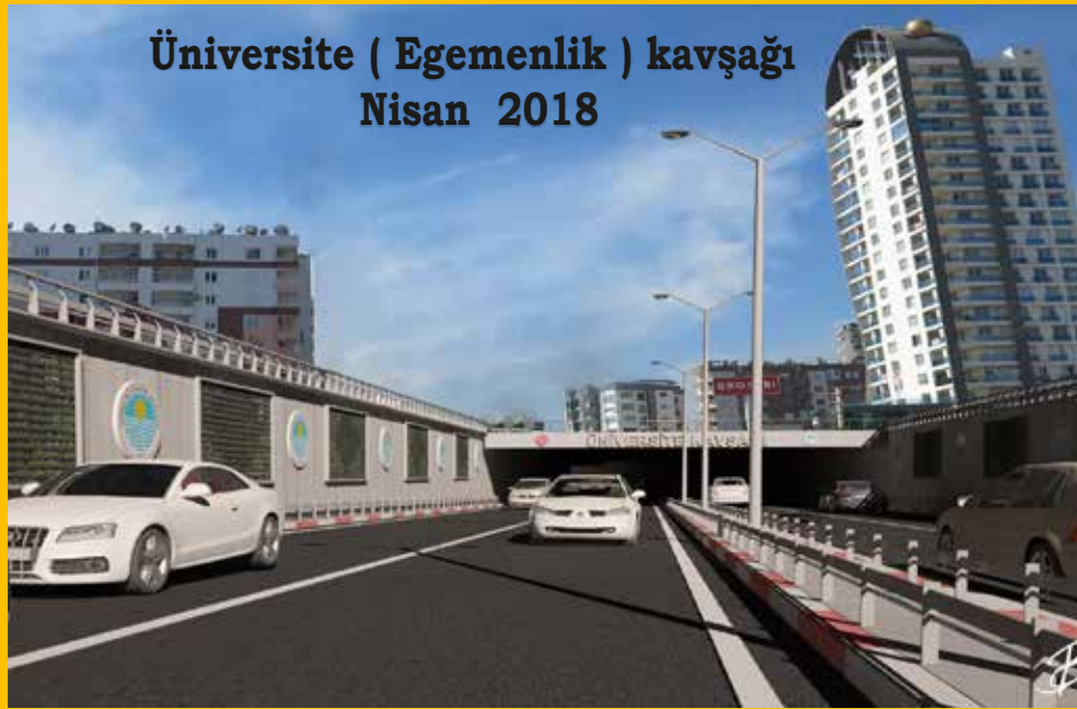
Üniversite ( Egemenlik ) kavşağı Nisan 2018