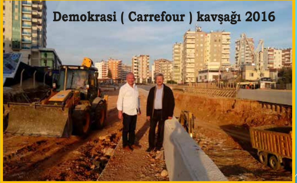
Demokrasi ( Carrefour ) kavşağı 2016